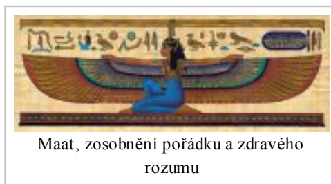
Maat, zosobnění pořádku a zdravého rozumu

Maat představovala princip moudrosti, dle něž se příroda zařizovala. Jako taková je protiváhou Nun, protože zatímco Nun je vodnatá neformnost, Maat je řádem stvoření 14 . Maat byla v Egyptě také ručitelkou civilního pořádku, pročež farao, jakkoli byl pokládán za božstvo s neomezenou mocí, musel se řídit pokyny Maat a udržovat pořádek. Paralelu Maat nalzáme v Prísloví, když je Moudrost personifikována jako ta, která „křičí na ulicích, na náměstích pozvedá svůj hlas“ (Př 1,20–33) 15 .