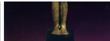
Ptah, bůh řemeslník

jakémsi intelektuálním pozadí hmotného světa a jeho zákonitostí. Toto intelektuální pozadí poskytl egypt'anům Ptah, který byl jako bůh řemeslník k přenášení samotných myšlenek do beztvaré materie nejlépe kvalifikován. V Bibli tento koncept nalezneme v Janově evangeliu, když čteme, že „na počátku bylo Slovo“ 28 .