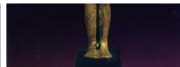
Ptah, bůh řemeslník

jakémsi intelektuálním pozadí hmotného světa a jeho zákonitostí. Toto intelektuální pozadí poskytl egypt'anům Ptah, který byl jako bůh řemeslník k přenášení samotných myšlenek do beztvaré materie nejlépe kvalifikován. V Bibli tento koncept nalezneme v Janově evangeliu, když čteme, že „na počátku bylo Slovo“ 28 .