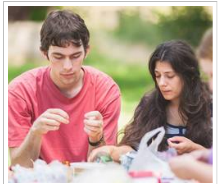
Navlékáme korálky. Jak symbolické...

Před obědem je první celofestivalové setkání objasňující jeho vizi. Hovoří Radek Smetana jako svědek několika probuzení: Doporučuje knihu Oheň probuzení. Modlitba není jedinou ingrediencí. Je potřeba Božské ingredience, která umocní naši píli. Při probuzení se projevují fenomény: padání, třesení, vnitřní obnova. Probuzení nese dvojí aspekt: obnovení v církvi a efektivní evangelizaci. Na různých místech ve světě se šušká, že přichází čas pro Evropu. Při probuzení přicházejí služebnosti, které přesahují jeden sbor a jednu církev. Např. Anacondia zasáhl celý národ. Proto máme KF, abychom (my, jeho organizátoři a garanti,) zahlédli jakousi naději.