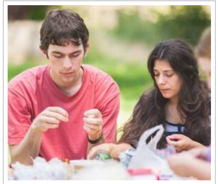
Navlékáme korálky. Jak symbolické...

Před obědem je první celofestivalové setkání objasňující jeho vizi. Hovoří Radek Smetana jako svědek několika probuzení: Doporučuje knihu Oheň probuzení. Modlitba není jedinou ingrediencí. Je potřeba Božské ingredience, která umocní naši píli. Při probuzení se projevují fenomény: padání, třesení, vnitřní obnova. Probuzení nese dvojí aspekt: obnovení v církvi a efektivní evangelizaci. Na různých místech ve světě se šušká, že přichází čas pro Evropu. Při probuzení přicházejí služebnosti, které přesahují jeden sbor a jednu církev. Např. Anacondia zasáhl celý národ. Proto máme KF, abychom (my, jeho organizátoři a garanti,) zahlédli jakousi naději.