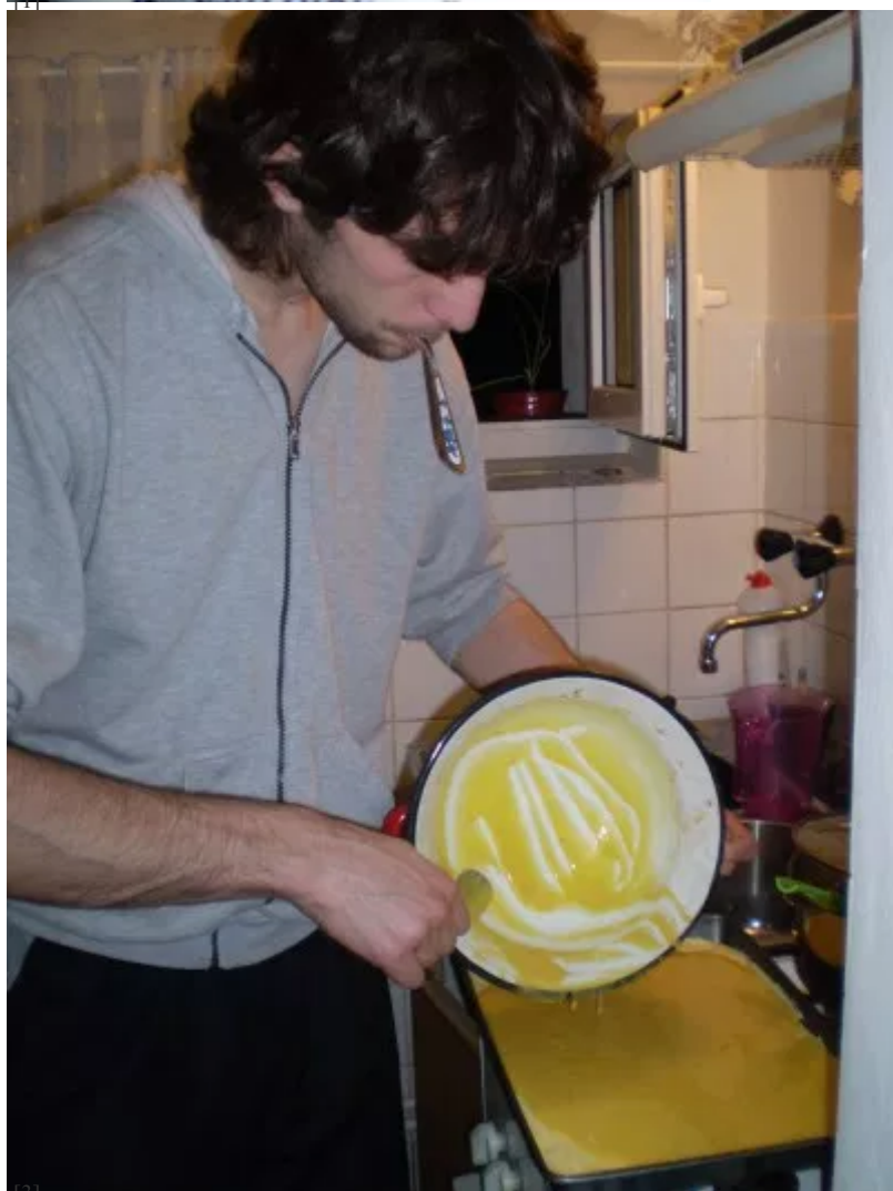
[3] Vylévání těsta

http://ampm.buban.cz/vestnik/o-tom-co-jsme-dostali-jak-se-mame-a-co-delame/